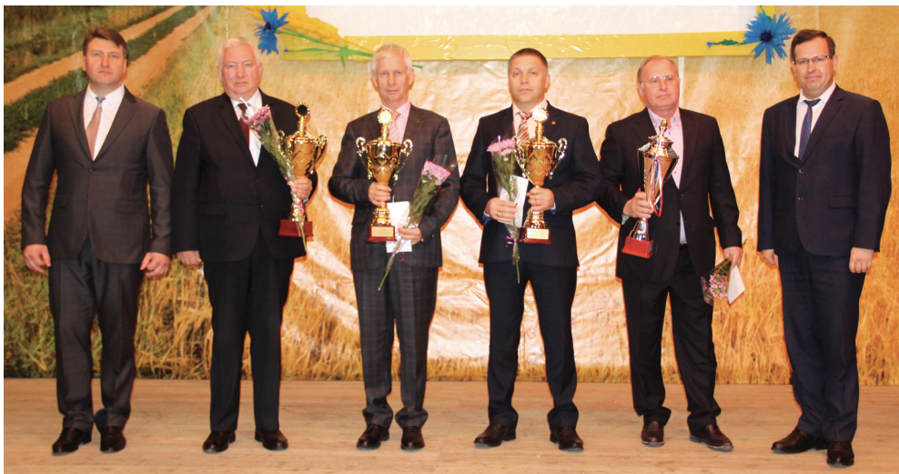
Руководители предприятий-флагманов сельского хозяйства Ирбитского района.