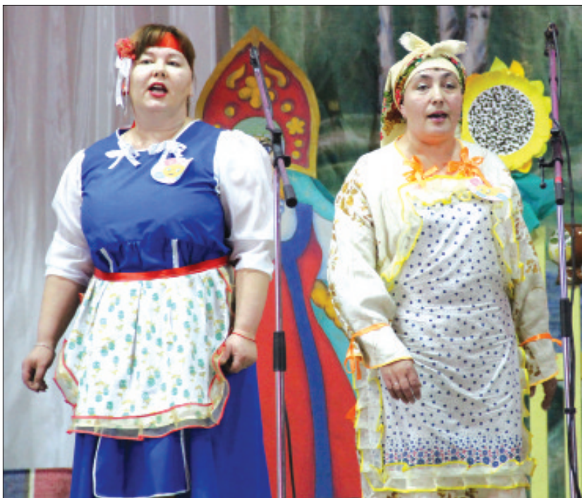
Ветеранский коллектив «Благодея» (д. Якшина).