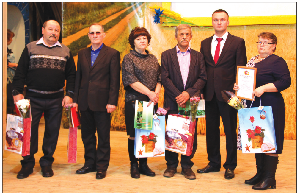
Обладатели высоких региональных наград.

- Весна была дождливой и снежной, но наши растениеводы и механизаторы собрали высокий урожай. Мы намолотили 104 467 тонн зерна. С каждого гектара собрали 27,5 центнера зерна. Рекордный урожай в этом году получили два предприятия - СПК «Килачевский» (47 центнеров с гектара) и СПК им. Жукова (40,1 центнера с гектара), - подвел итоги Иван