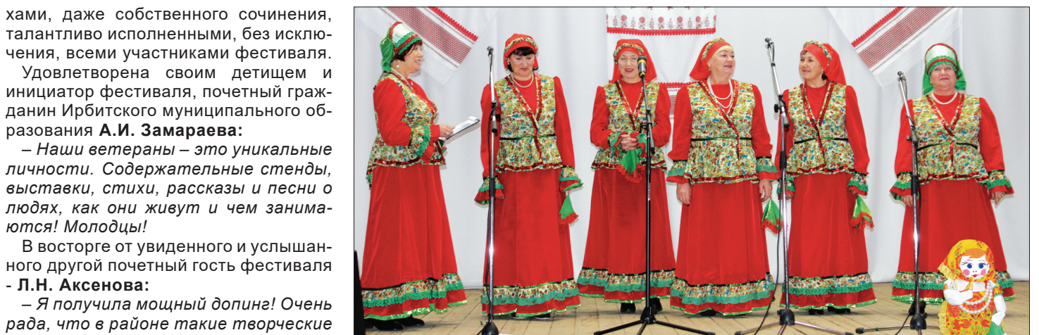
Ветеранский клуб «Журавушка» (д. Бердюгина).