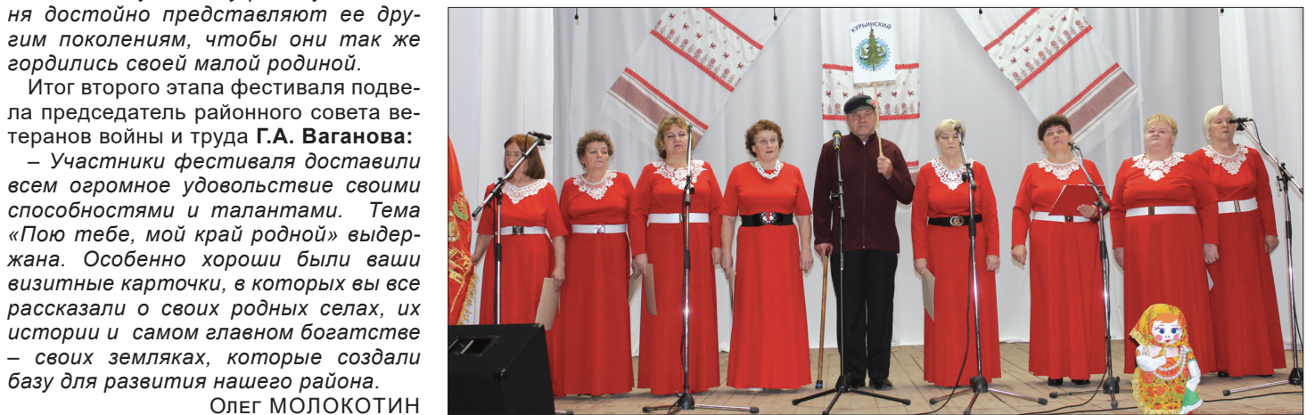
Ветеранский коллектив «Уральская рябинушка» Курьинского ДК.