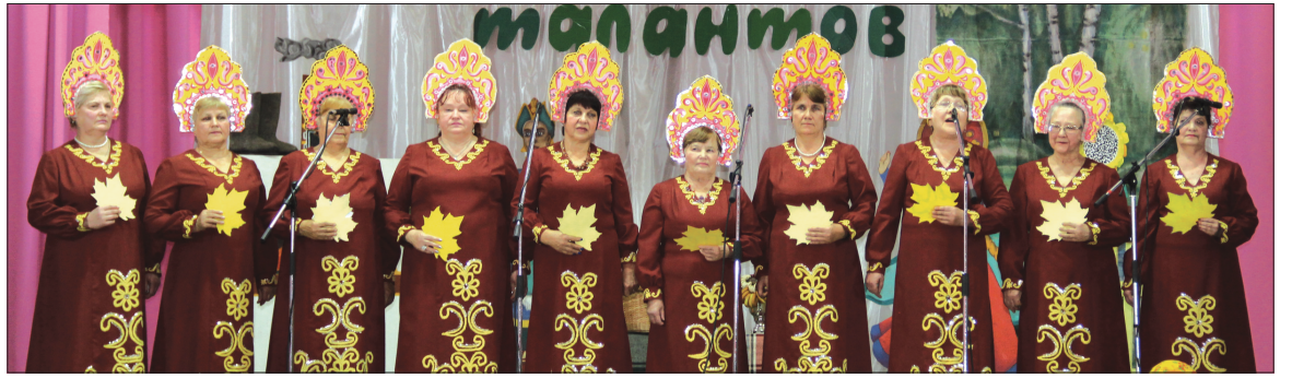
Фольклорная группа «Сударушка» (с. Горки).