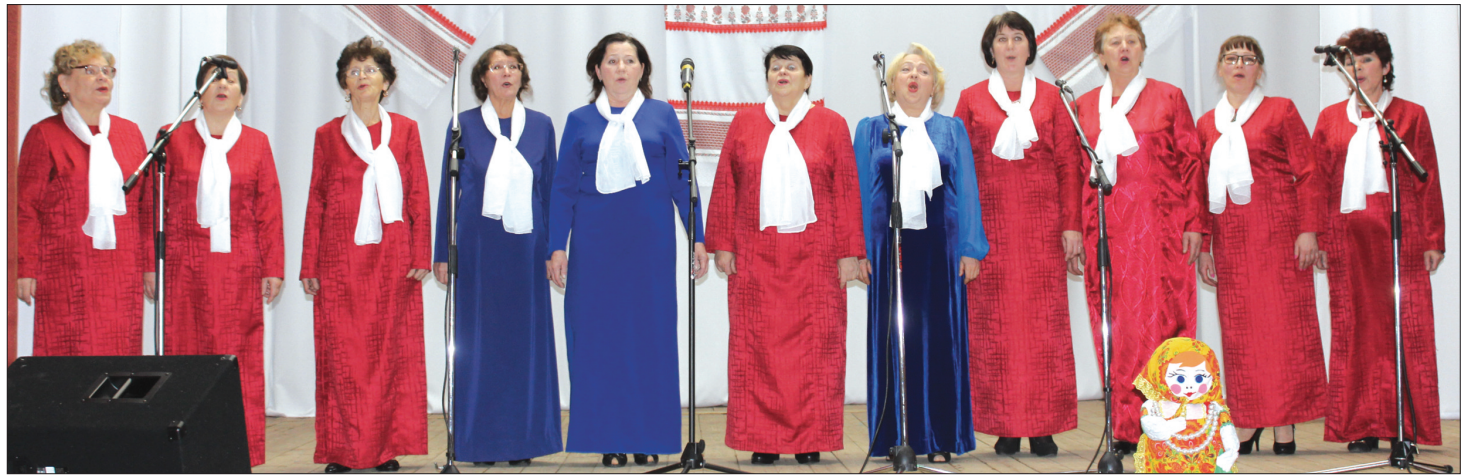
Женский клуб «Зоренька» Ключевской ветеранской организации.

Все эти рассказы о родном крае и России дополнялись песнями и сти-