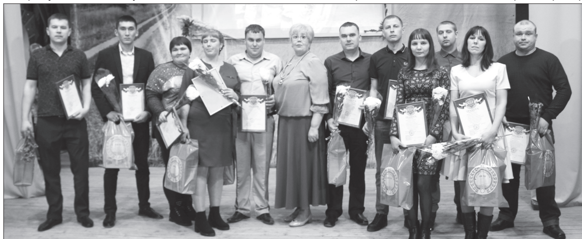
Перспективная молодежь сельского хозяйства Ирбитского района.