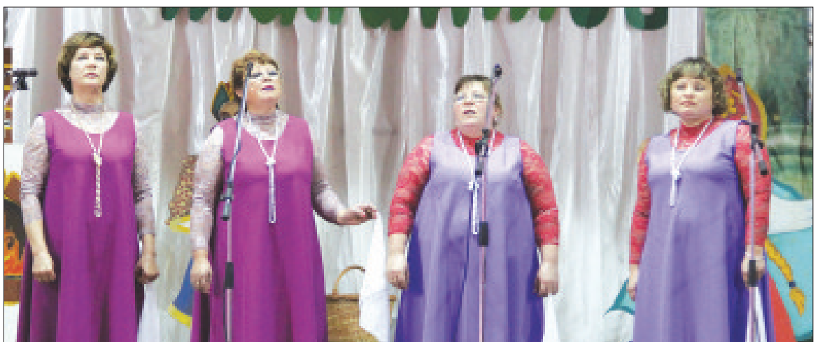
Группа «Селяночка» Лаптевской ветеранской организации.