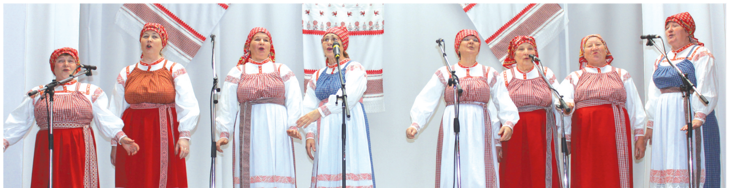
Вокальная группа «Журавушка» Ницинского СДК.