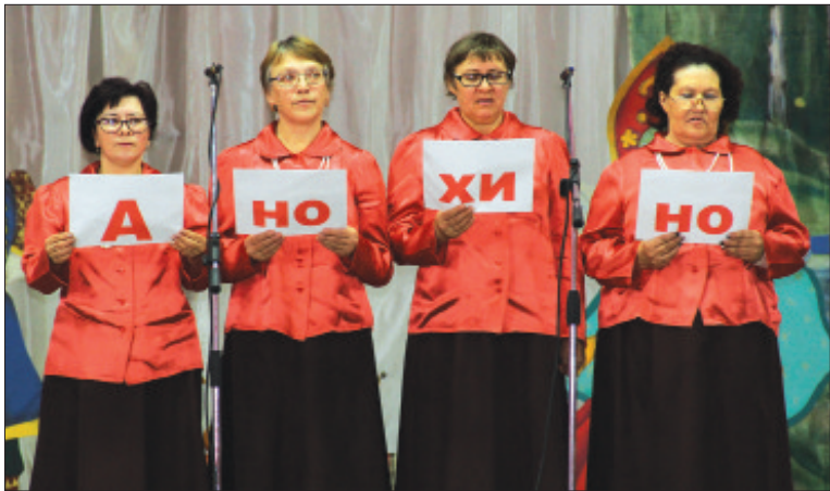
Анохинская сельская библиотека.

- Вы делаете все на благо района, чтобы он процветал, вносите огромный вклад в социальное развитие, учите и помогаете нашей молодежи. Вы передаете нам свои знания, делитесь накопленным опытом и, конечно, радуете своим творчеством. Труд ваш неocenим и очень важен для